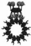
Anbindung des CaMKII an ein A-Gitter des Mikrotubulus